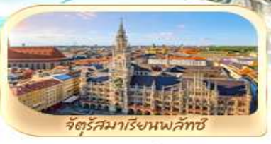
จัตุรัสมาเรียนพลัทซ์