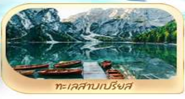
ทะเลสาบปริงส์