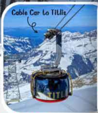
Cable Car to Titlis