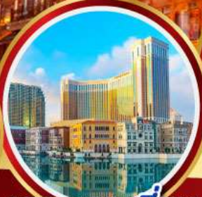
เดอะเวเนเซียน