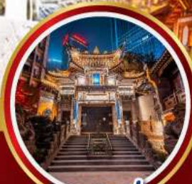
วัดหลัวอัน