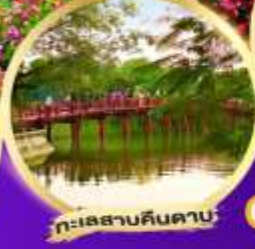
ทะเลสาบคินคาบ