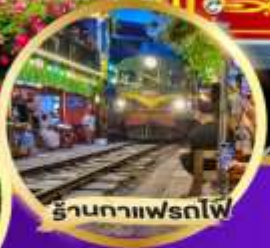
ร้านกาแฟฟรตโพ