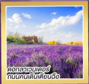
ดอกลาเวนเดอร์ ถนนคนเดินเตียนฉือ