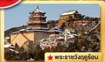
★ พระราชวังฤดูร้อน