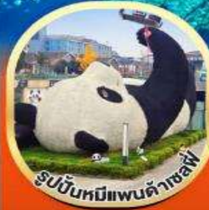
รูปปั้นหมีแพนด้าเซฟี่