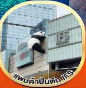
แพนด้าปีนตึกIFS