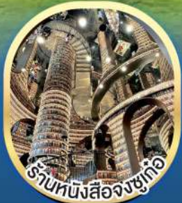
ร้านหนังสือจงซูเก้อ