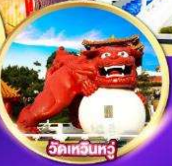
วัดเหวินหัว

โรงละครไทจง-หมู่บ้านปิตาจชไต วัดเหวินหัว, วัดหลงชาน-ล่องเรือทะเลสาบสุริยันจันทรา พิพิธภัณฑที่แห่งชาติกู่กง-ถนนโบราณจิวเฟิ่น ช้อปปิ้งตลาดไทจง, ตลาดซีเหมินติง, Gloria Outlet