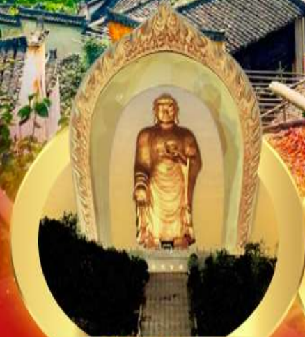
พระใหญ่ตงหลิง