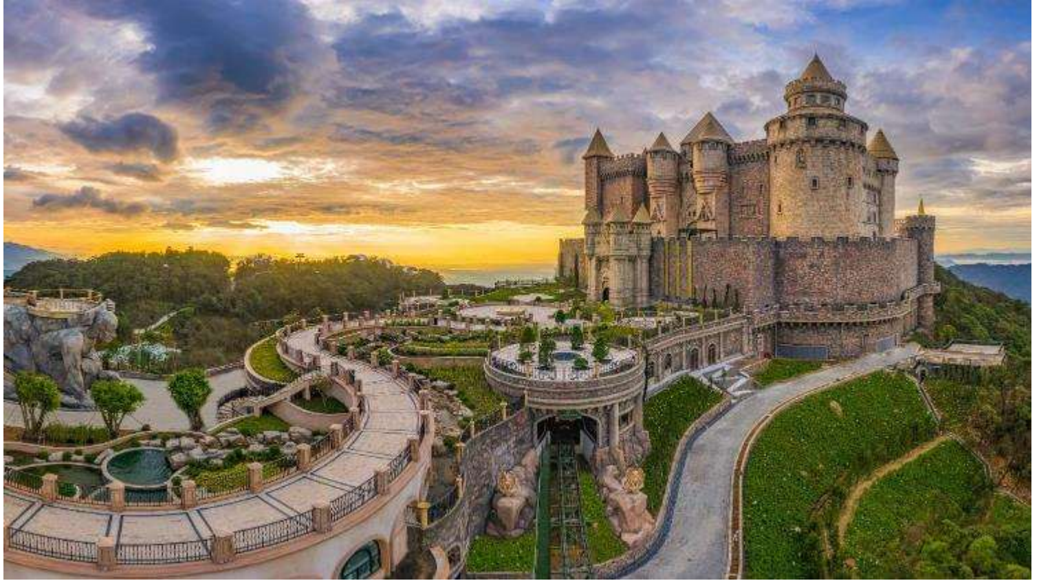
กลางวัน รับประทานอาหารกลางวัน ณ ภัตตาคาร (มีที่ 2) * เมนูพิเศษ บุฟเฟ่ต์นานาชาติ บนบานาฮิลล์