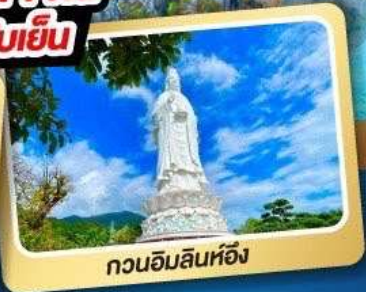
กวนอิมลินท้อ