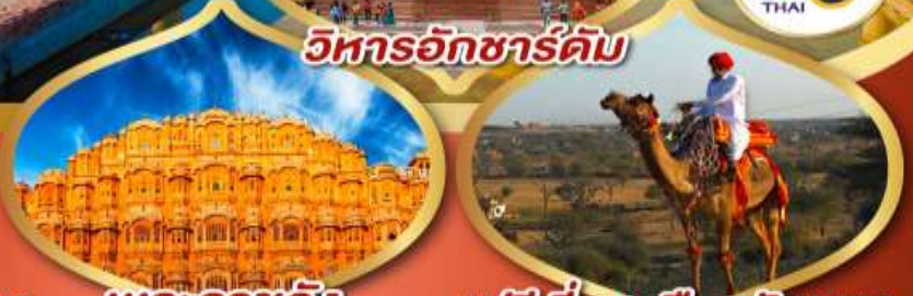
วิหารอักชาร์ดัม