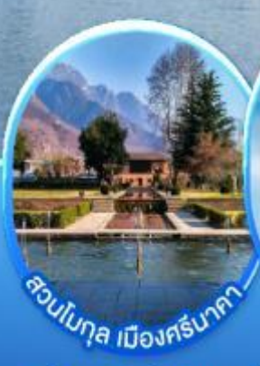
สวนโมกุล เมืองศรีนาคา