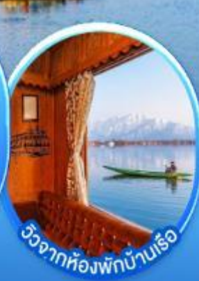
วิวจากห้องพักบ้านเรือ