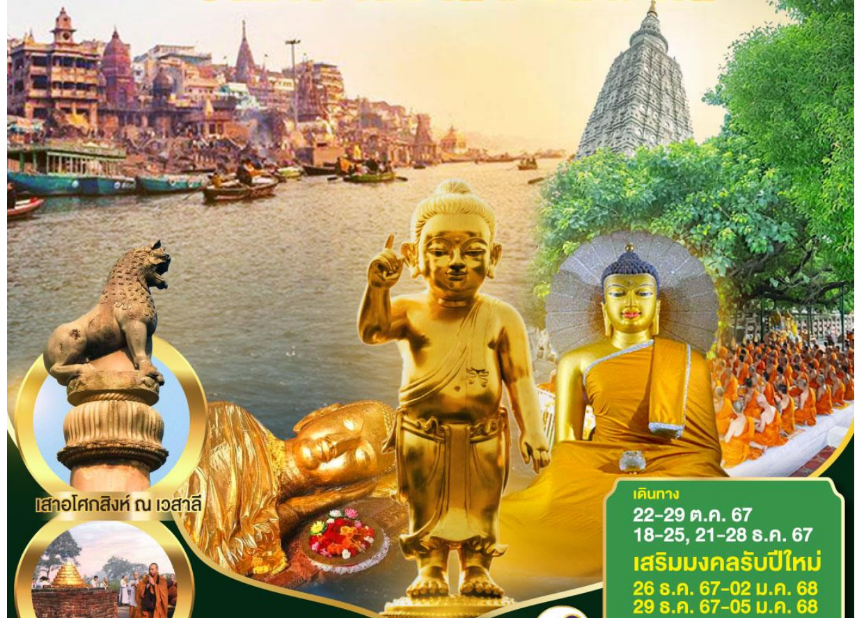
เสาอโศกสิงห์ ณ เวสาลี