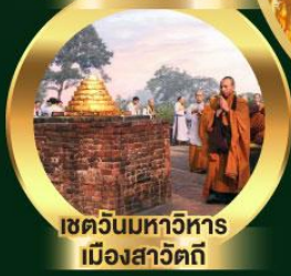
เขตวันมหาวิหาร เมืองสาวิตรี