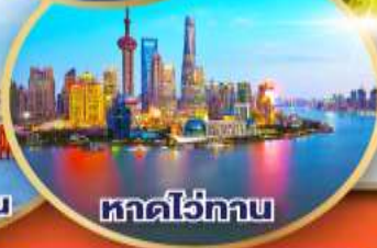
หาดไว่กาน