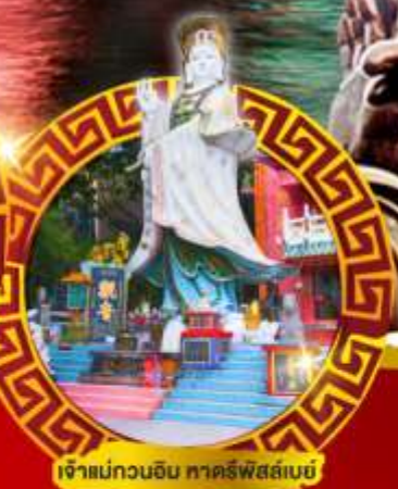
เจ้าแม่กวนอิม ทาครีพีส์ลันท์

เมนูสุด พิเศษ!! ต้มช้ำฮ่องกง บุฟเฟ่ต์ชาบูสโตร์ฮ่องกง, ห่านย่าง