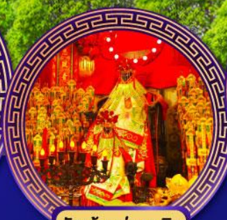
วัดเจ้าแม่กวนอิม ช่องอ่า