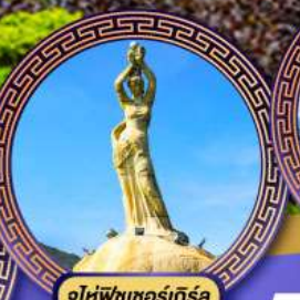
จูให้พิชชองีร์รา