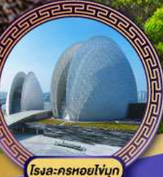
โรงแคชอยใหญ่