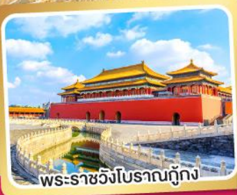
พระราชวังโบราณกู้กง