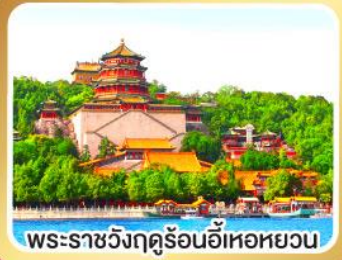
พระราชวังฤดูร้อนอี่เหอหยวน