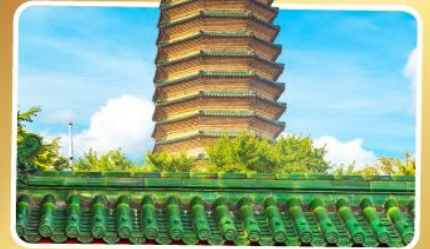
วัดพระเจี๊ยะกั๋ว

เมนูพิเศษ เปิดปักกิ่ง, ชาหมูหม้อไฟ อาหารกวางตุ้ง, อาหารเสฉวน