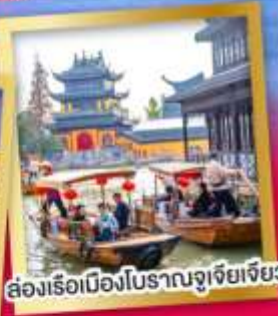
ล่องเรือเมืองโบราณจูเจียเจียว