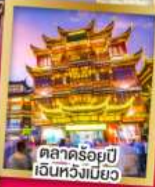
ตลาดร้อยปี เงินหวังเมี่ยว