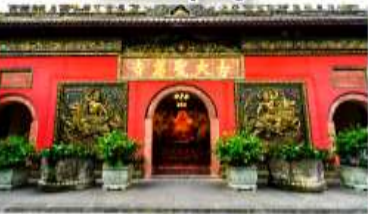
วัดต้าเจี๊ว