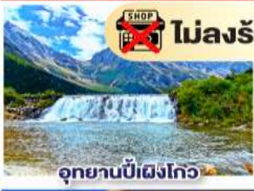
อุทยานปีฝั่งโกว