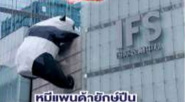
หมีแพนด้ายักษ์ปิ่น ตึกถนนซุนซีลู่