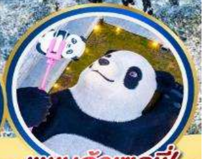
แพนต้าเซลฟี