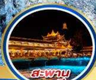
สะพาน หนานเฉียว