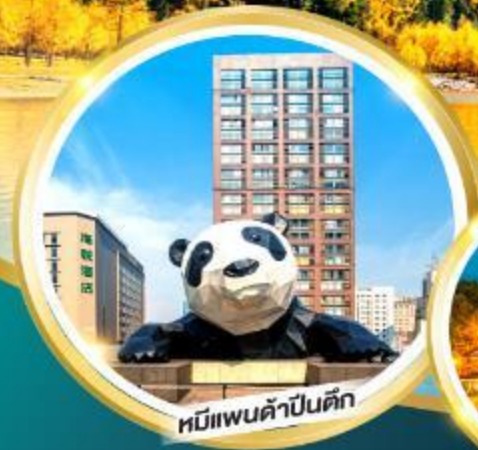
หมีแพนด้าป็นตัก