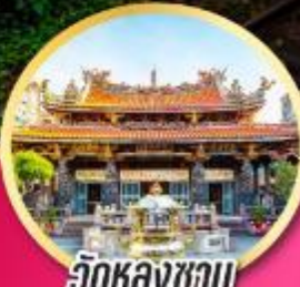
วัดหลงชาม