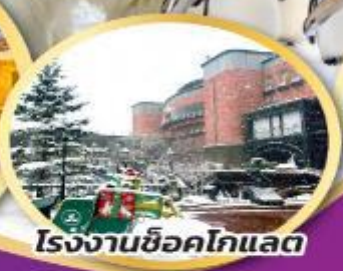
โรงงานช็อคโกแลต