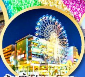
ช้อปปิ้งย่านซากาเอะ