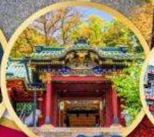
ศาลเจ้าโทโฮคุ