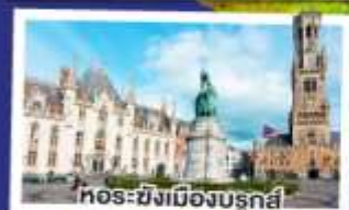
หอระฆังเมืองบรูคส์