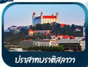
ปราสาทบราติสลาวา