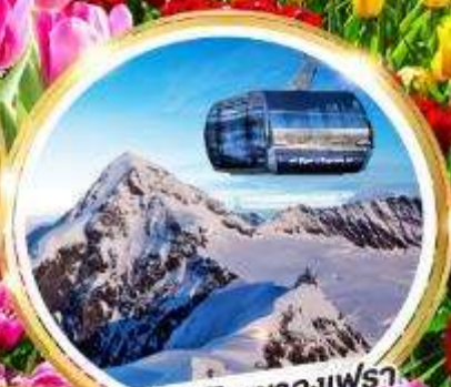
กระเช้าพิชิตเขาจุงเฟรา