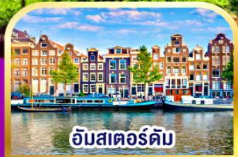
อัมสเตอร์ดัม