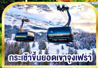
กระเช้าขึ้นยอดเขาจุงเฟรา