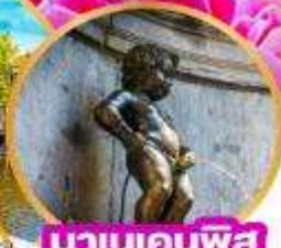
มานเคนพิส