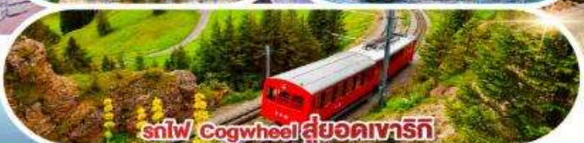
รถไฟ Cogwheel สูยอดเขารัก