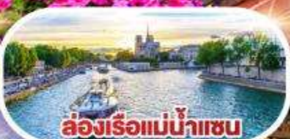
ล่องเรือแม่น้ำแชน