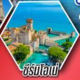
ซีร์มิโอนี่