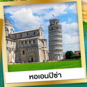
หออนปีซ่า