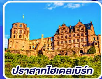
ปราสาทไฮเดิลเบิร์ก