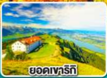
ยอดเขารัทท์