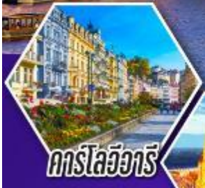
คาร์ลสบาด