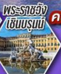
พระราชวัง เซินบรุนน์