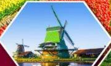
หมู่บ้านกังหันลม ซานส์ตีบส์