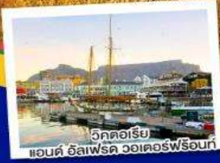
วิกตอเรีย แอนด์ อัลเฟรด วอเตอร์ฟร้อนท์