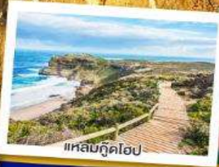
แหลมกู๊ดโฮป