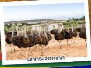
นกกระ-จอกเทศ