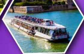
ล่องเรือบาโตมุซ ชมกรุงปารีส

เที่ยวเมืองวาอุซ เมืองหลวงของสาธารณรัฐ ลิกเทินสไตน์