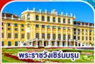
พระราชวังซิรินบรุน