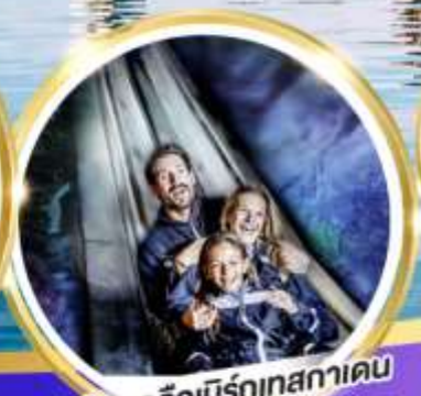
เหมืองเกลือบิรท์เทศาเคน