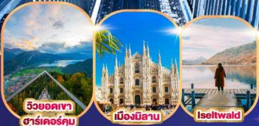
วิวยอดเขา ซาร์เตอร์คัม