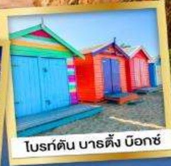
โบสถ์ดิน บาร์ตัง บ็อกซ์