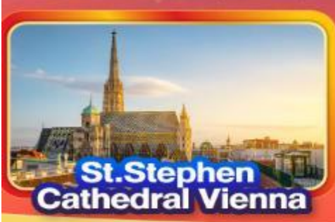
St. Stephen Cathedral Vienna