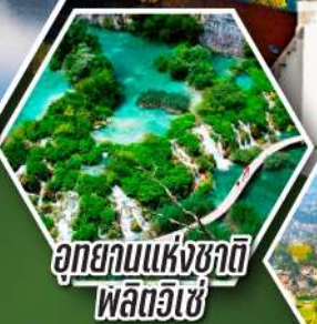
อุทยานแห่งชาติ พลิตวิเซ่