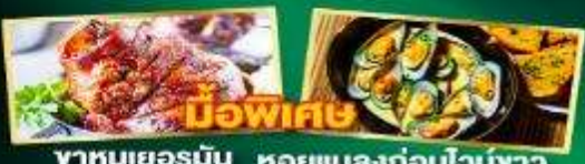
หมูพะพีศ พาหมูเยอรมัน หอยแมลงภู่อบไวน์ขาว