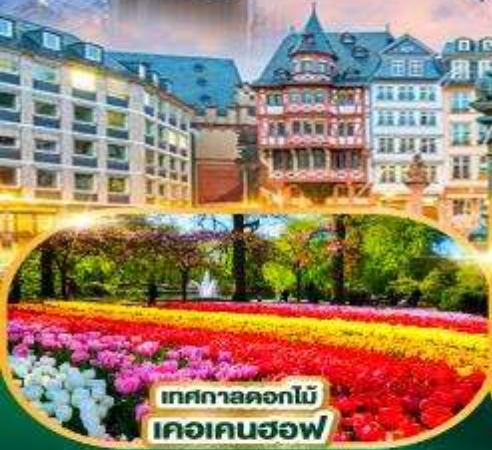
เทศกาลดอกไม้ เคอเคนฮอฟ